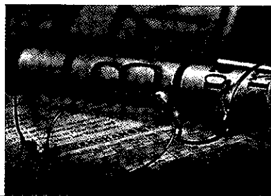
文 ■ 吳志光、池美佳